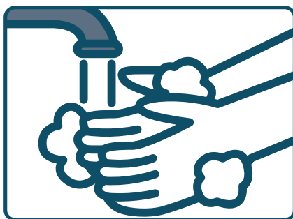
手洗いしましょう