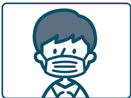
マスクを着用しましょう